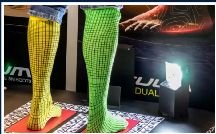
3D skreniranje stopala i izrada pancERICA

Svi klijenti koji uplate skijaške aranžmane preko agencije Palma Travel dobit će voucher 10% popusta najam ski opreme u Lauf ski shopu