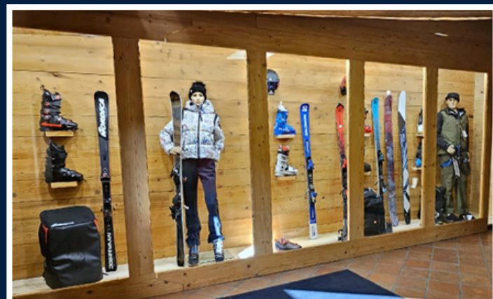
Prodaja skijaške opreme