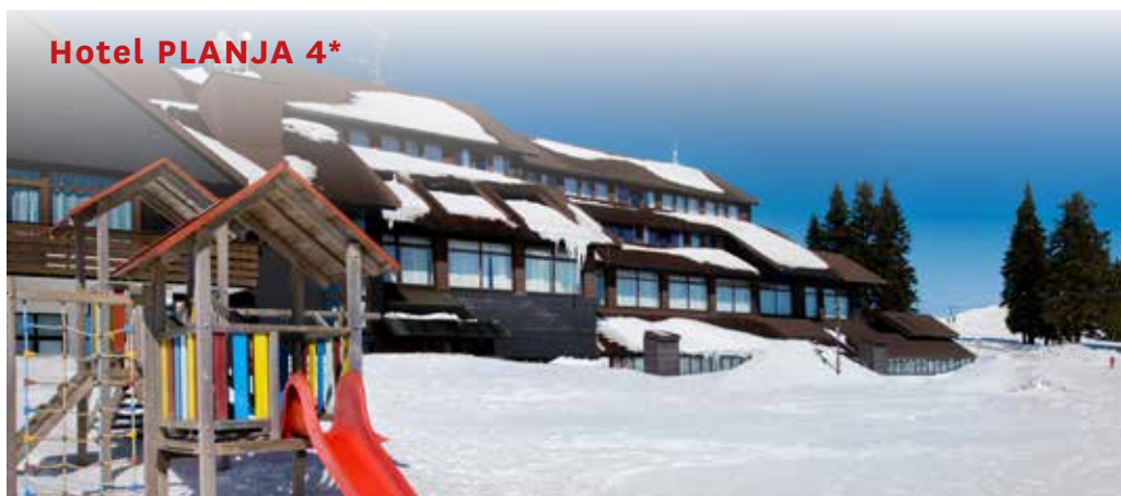
Hotel PLANJA 4*