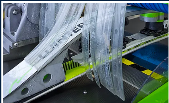
Servis skija i snowboarda