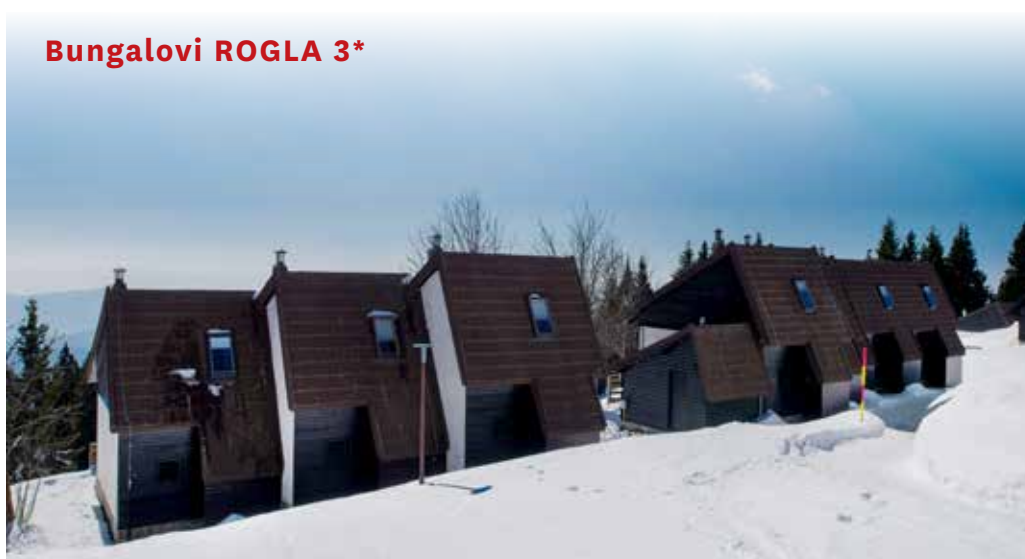
Bungalovi ROGLA 3*

Doplate na recepciji: za boravišnu pristojbu 2,50 € / 18,84 kn po osobi dnevno (djeca od 7-18 g. 1,25 € / 9,42 kn dnevno), za prijavu 3 € / 22,60 kn jednokratno (za osobe starije od 18 godina), za dječji krevetić 10 € / 75,35 kn dnevno.